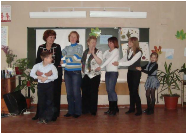
Сценка «Репка» Инсценирование сказки.

Конкурс «Кулинар» (назвать блюда, которые можно приготовить из овоща, найденного в мешке).